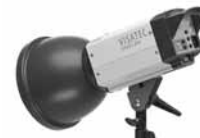
51.070.00 LOGOS 800 BC 200-240 V/50 Hz bi-voltage