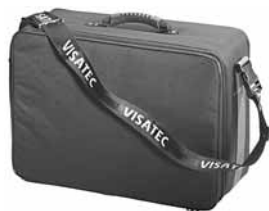
56.503.00 Sacoche de transport, vide pour VISATEC Kits 108