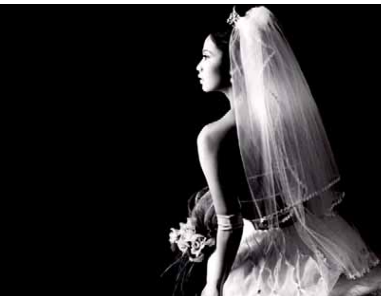
Frida-Orkid Studio, Indonésie

Grâce à la fixation à baïonnette, tous les accessoires sont rapidement interchangeables. Tous les réflecteurs peuvent être tournés sur 360°, ce qui constitue un gros avantage pour des coupe-flux et des boîtes à lumière rectangulaires.