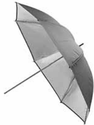
53.452.00 Parapluie, argente