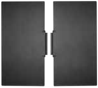
53.221.00 Coupe-flux pour réflecteur diffusant