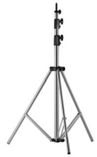
55.103.00 Pied XL