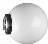
53.122.00 Globo Ballon en verre acrylique, résistant aux rayons ultraviolets, Ø 30 cm