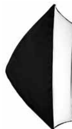
53.417.00 Soloflex 60 x 90 60 x 90 cm