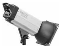
51.010.00 SOLO 800 B 120 V/ 60 Hz