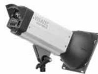
51.102.00 SOLO 1600 B 120 V/60 Hz