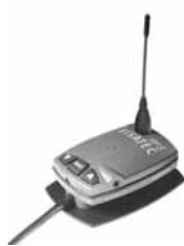
56.202.00 Émetteur/récepteur RFS