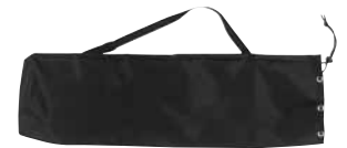
56.550.00 Sac pour 3 pieds, vide