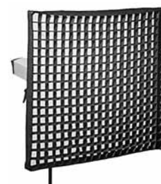
53.202.00 Grille de tissu pour Soloflex 80