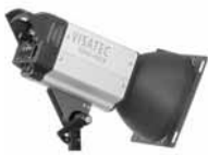
51.130.00 SOLO 400 B 120 V/60 Hz

Flash compact, avec tube-éclair, lampe pilote, cloche de protection en verre et capuchon de protection gris.