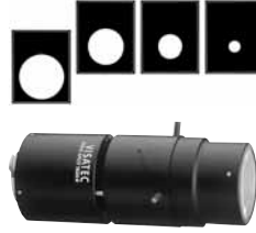
53.130.00 Adaptateur de projection Solospot 1600 B avec tube-éclair, cloche de protection en verre, porte-gobos et 3 masques à trous