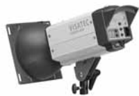
51.040.00 LOGOS 800 200-240 V/50 Hz bi-voltage