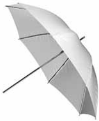
53.451.00 Parapluie, transparent