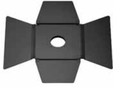
53.121.00 Adaptateur Sunlite