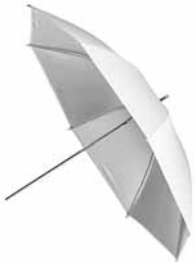
53.453.00 Parapluie, sun