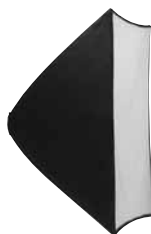
53.408.00 Soloflex 80 80 x 80 cm