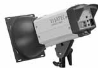
51.050.00 LOGOS 1600 200-240 V/50 Hz bi-voltage