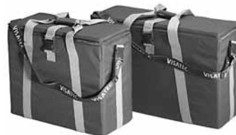
56.506.00 Sacoche de transport, vide pour VISATEC Kits 204, 208, 216