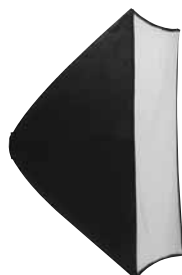
53.409.00 Soloflex 100 100 x 100 cm