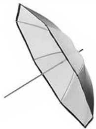
53.450.00 Parapluie, blanc