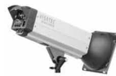
51.104.00 SOLO 3200 B 120 V/60 Hz