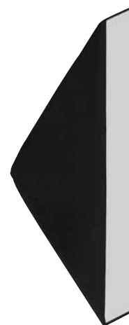
53.416.00 Soloflex 80 x 160 80 x 160 cm